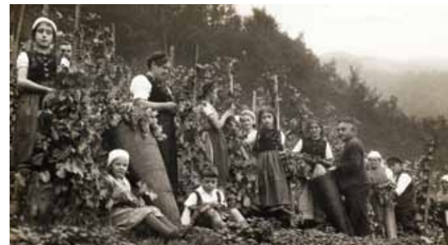
Weinlese in den 1920er Jahren.